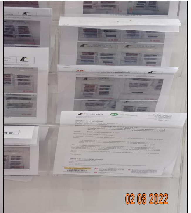
EDICTO R_34896 YC-CRT-117011